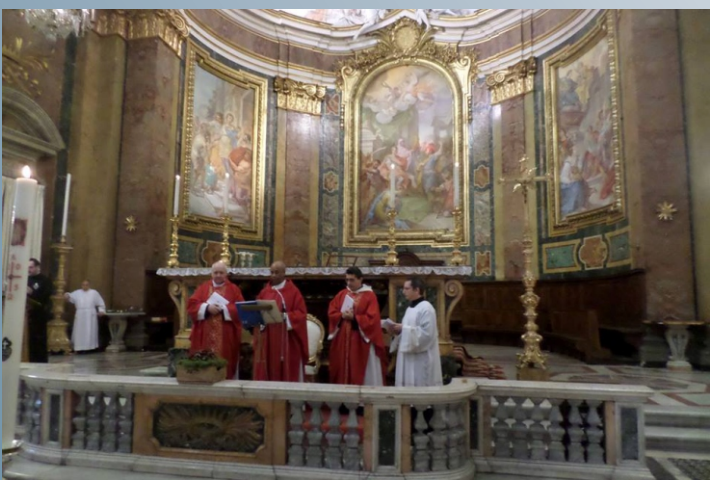
Missa de Abertura na Basílica dos Santos Mártires João e Paulo.

se seguiram, os membros do Sínodo examinaram a vida e missão da Família Passionista à luz do tema do Sínodo: "A vida passionista: a chamada à santidade na comunidade para a evangelização".