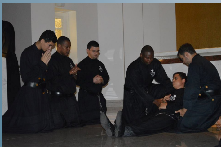
No dia do Trânsito de São Paulo da Cruz, os junioristas prepararam um bela apresentação de teatro, retratando como foi a partida de Paulo da Cruz para a morada eterna.