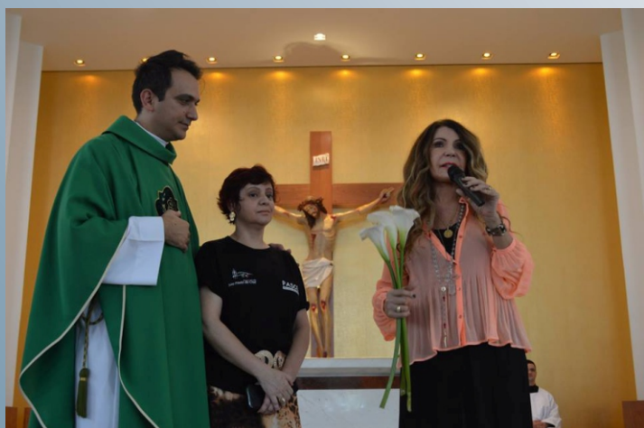
No dia 18 de Outubro, a cantora Elba Ramalho esteve em nosso Santuário, deixando uma breve e linda mensagem em defesa da vida.