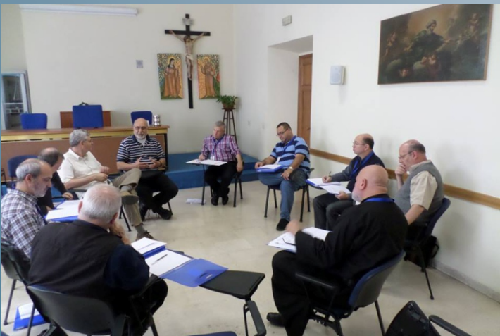
Configuração de Jesus Crucificado: Brasil, Argentina, Uruguai, México, Porto Rico, República Dominicana, EUA e Canadá.