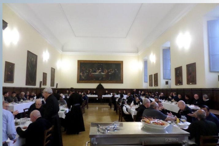
Manhã orante e de confraternização no dia de São Paulo da Cruz.