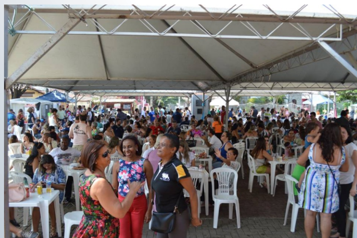
Nas confraternizações externas, a Praça do Santuário exalou alegria e felicidade com o povo do Barreiro.