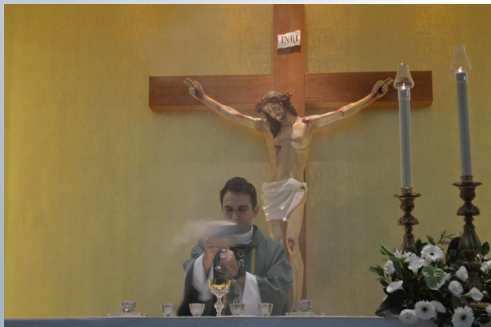
As novenas aconteceram de 10 a 19 de Outubro no Santuário dedicado a São Paulo da Cruz, localizado no Bairro do Barreiro em Belo Horizonte/MG.